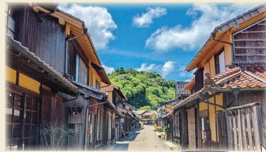
大森地区はレトロで温かみのある街です