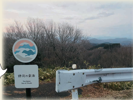
春・秋には 幻想的な光景が 見れるかも

島根県美郷町の野間雲海ビュースポット、田之原展望台は雲海のスポットとしても有名です。美郷町の雲海予報サイトを利用すると便利です