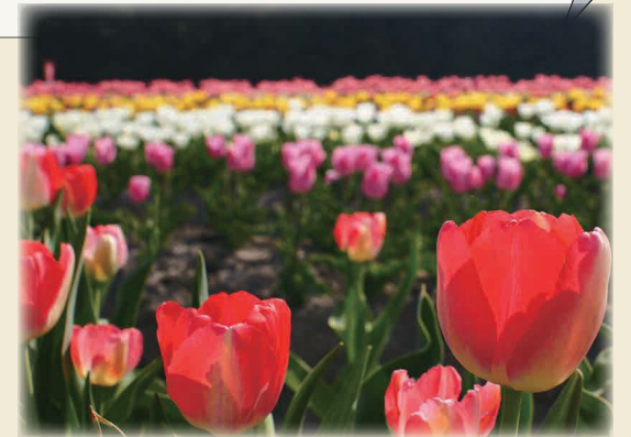
チューリップ畑 (安来市伯太町)

本田商店に入社して初めての営業職で、まだ勉強中の身ですが、一人でも多くの方に本田商店の事を 知って頂けるよう、日々精進していきます。