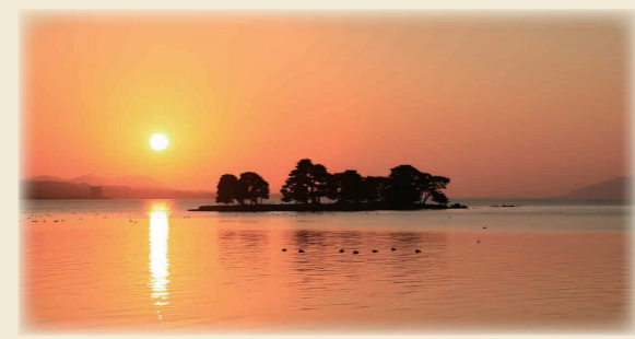
宍道湖に浮かぶ嫁ヶ島と夕日